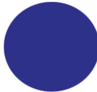
PANTONE 2758 C