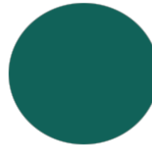
PANTONE 330 C