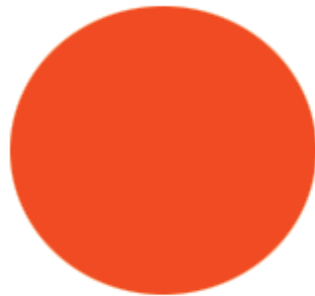
PANTONE 1788 C

La imagen gráfica consta de tres colores corporativos, que son los siguientes: