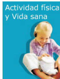
Actividad física y Vida sana

En esta sección, de color azul, se recogen los beneficios que el deporte aporta a la salud, así como las principales lesiones causadas durante el ejercicio físico, clasificadas según la zona del cuerpo donde se producen.