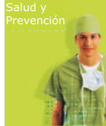
Salud y Prevención

En color verde, podrá acceder a una completa clínica virtual donde realizar sus consultas de todo tipo. Sexualidad, salud y viajes, adicciones, alergias, embarazos... ¡Un auténtico médico de familia virtual!